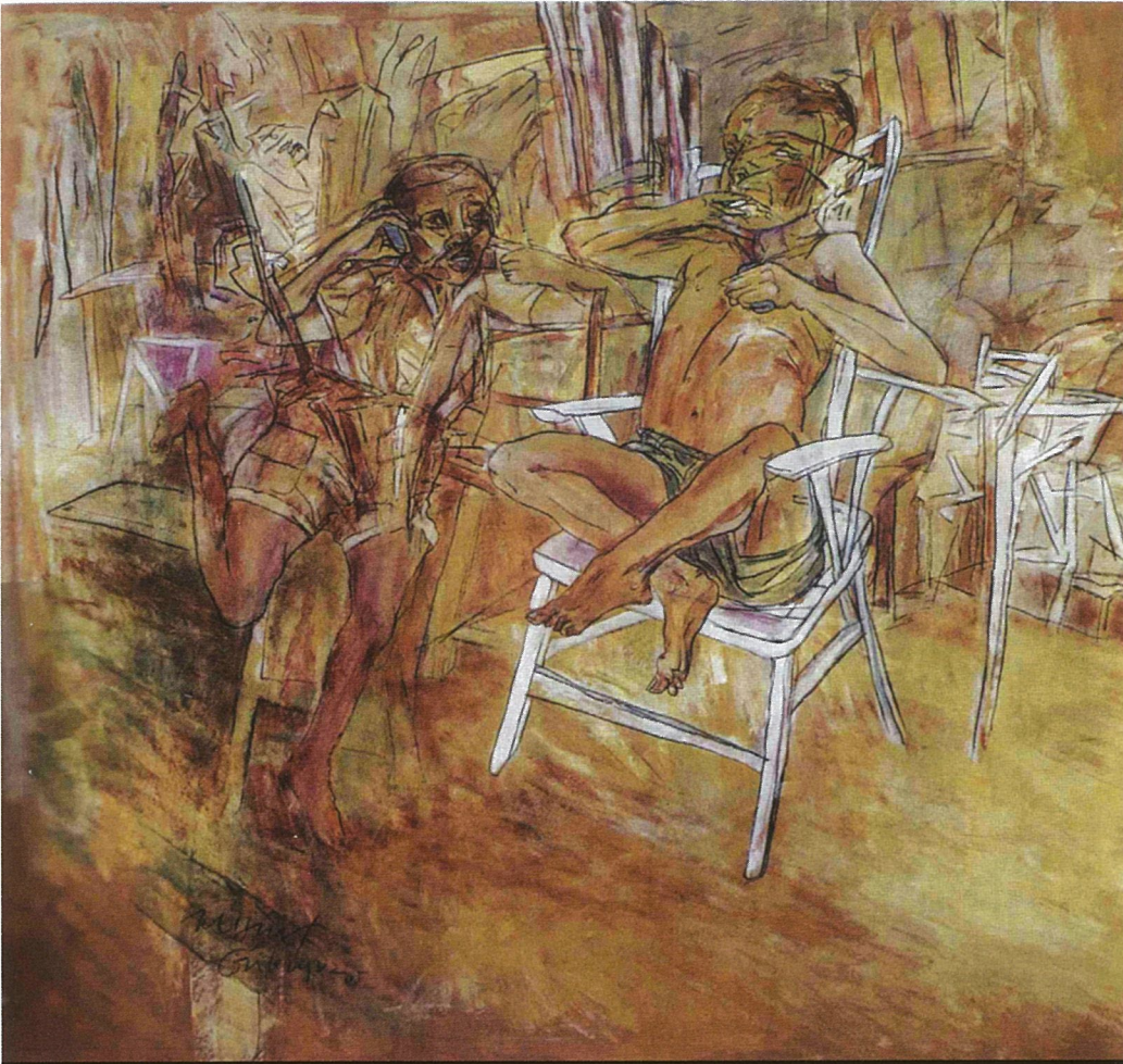
Güleriyüz'ün İzmir Agora Alışveriş Merkezi'nde açılacak olan yeni sergisinin adı 'Yaşamdan Sahneler.'

Güleriyüz will be opening at the İzmir Agora Mall on September 4 is 'Scenes From Life'.