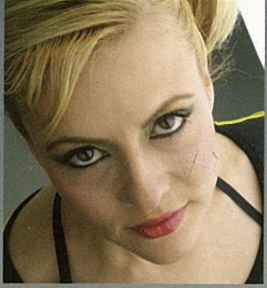
"GROWING OLD IN THIS CITY" "Bu şehirde yaşlanacağım"